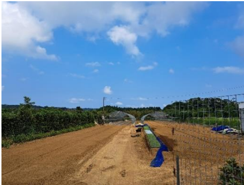
現和地区にある圃場

トマト栽培ハウスについては、直前の台風被害の影響で園芸農家様とお会いすることが出来ませんでした。圃場外から圃場の見学のみは実施したものの弊社システムの稼働状況の確認までは出来ませんでした。