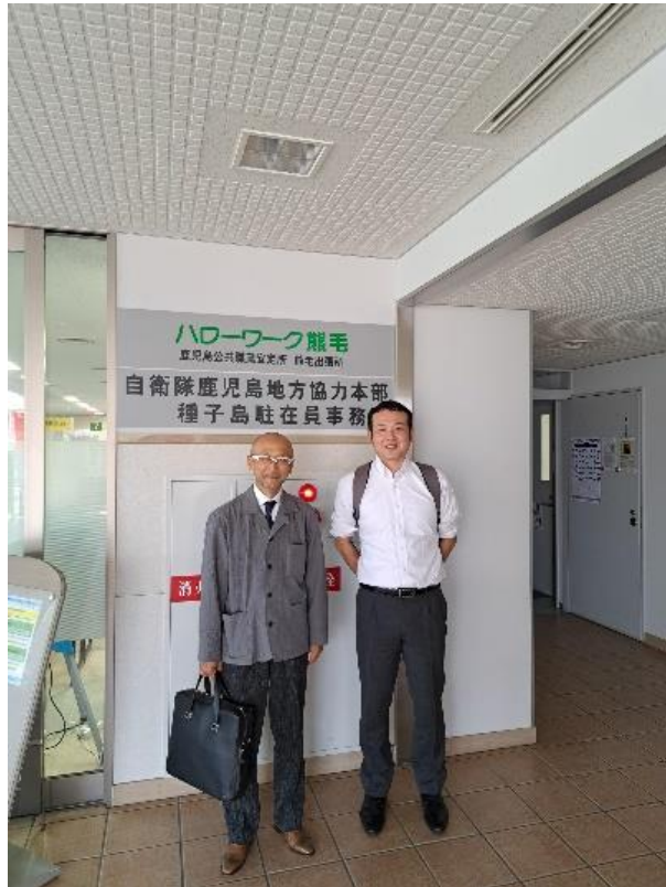
ハローワークにて

種子島・ハローワークを訪問し、担当者から若年層（特に高卒での就業希望者）についてのお話を聞くことが出来ました。