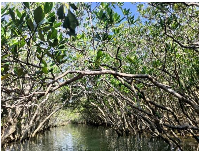
マングローブのトンネル