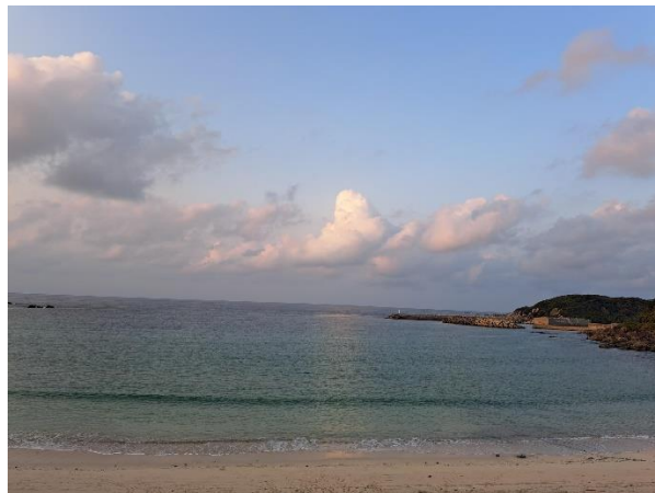
西之表市街地と海岸