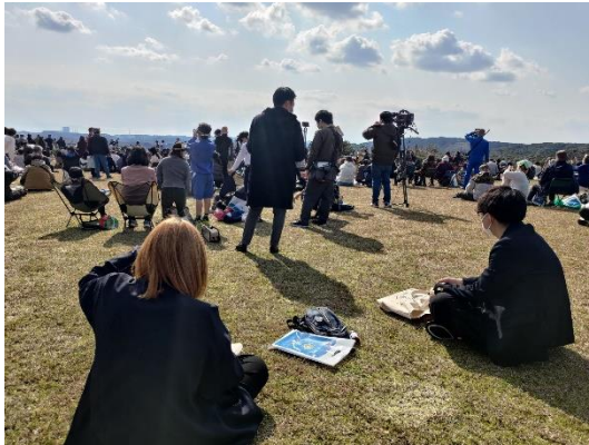
ロケットが打ち上がりず残念がる見学者たち（手前2名が弊社社員）

ロケットは残念ながら打ち上がりませんでした。貴重な瞬間に立ち会うことが出来ました。