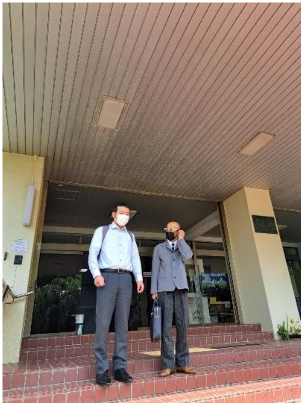
熊毛支庁玄関にて