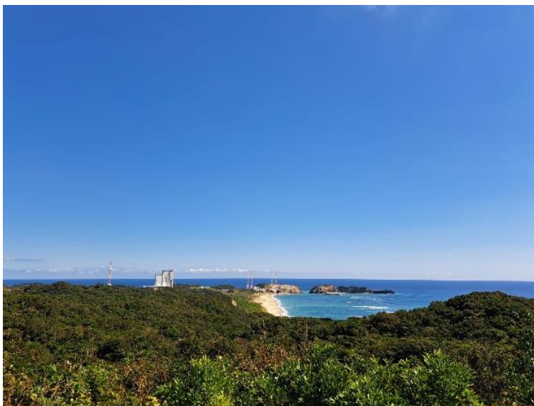
世界一美しいと言われるロケット発射場